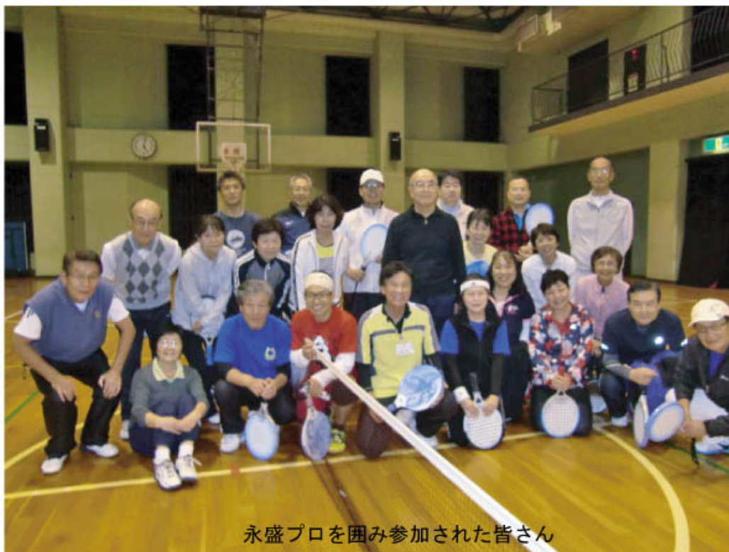
永盛プロを囲み参加された皆さん