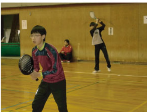
ジュニアも参加 ナイスプレー！