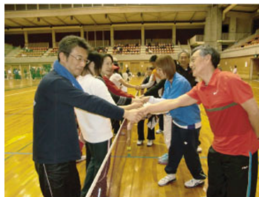
試合が終わってにこやかに握手